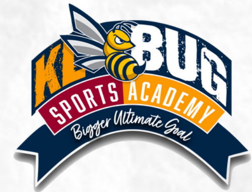
KL BUG Academy