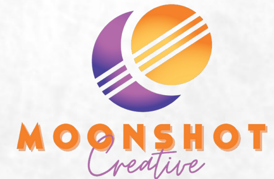
媒体配搭单位: MOONSHOT CREATIVE