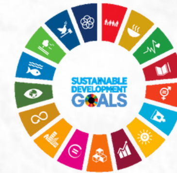
Malaysian CSO-SDG Alliance